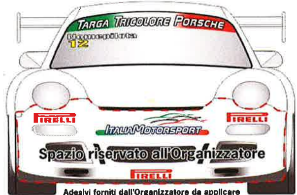
Adesivi forniti dall'Organizzatore da applicare a cura del Concorrente negli spazi indicati