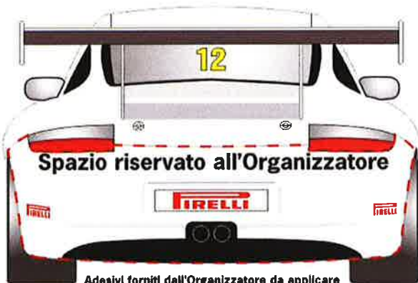
Adesivi forniti dall'Organizzatore da applicare a cura del Concorrente negli spazi indicati