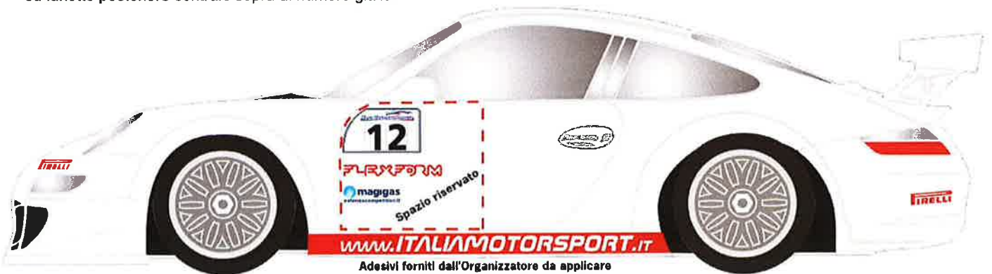
Adesivi forniti dall'Organizzatore da applicare a cura del Concorrente negli spazi indicati

- su lunotto posteriore centrale base cm.30 ca. dal tetto